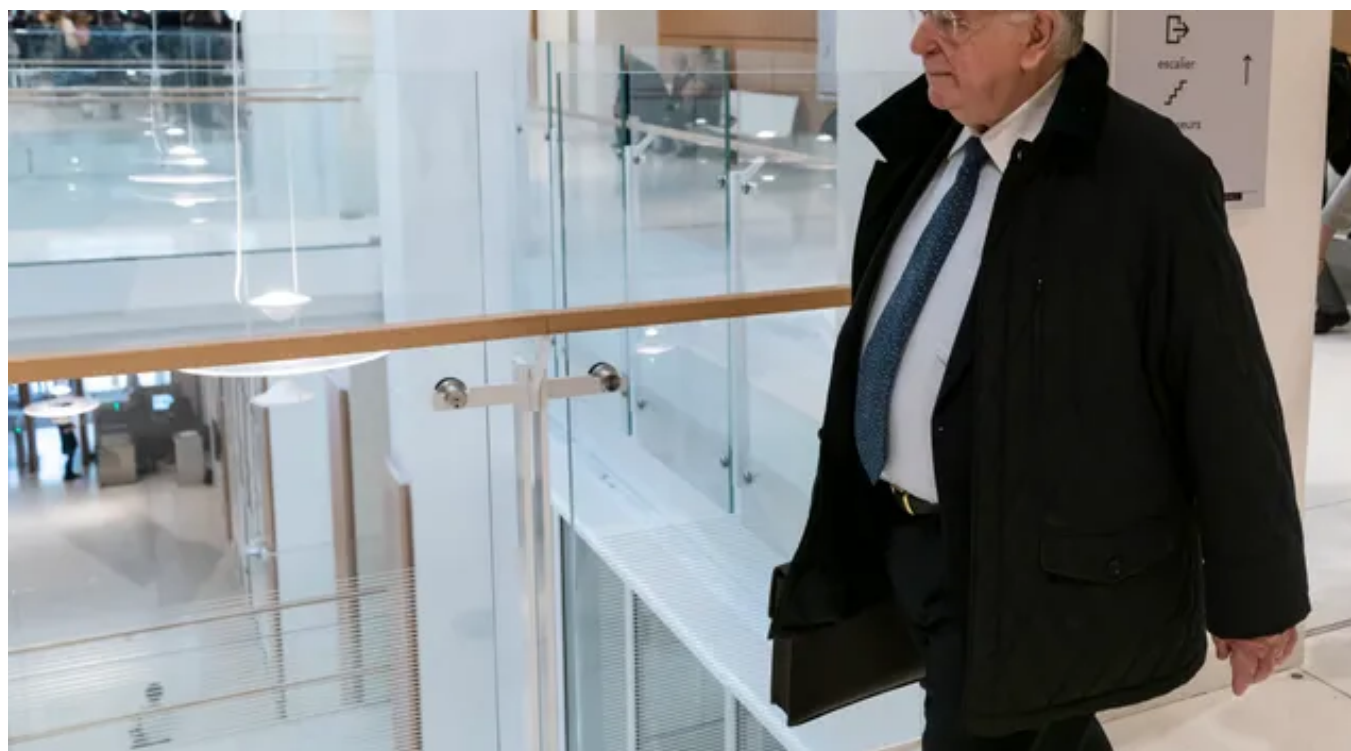
L'ex-PDG Didier Lombard, principal prévenu dans le procès France Télécom.

Des dizaines de témoins et de parties civiles ont été entendus à la barre. D'anciens employés de France Télécom toujours malades, d'autres qui s'en sont sortis ; la veuve, la fille, le frère d'agents qui se sont suicidés. La colère, le chagrin, la résilience se sont exprimés, retraçant une histoire qui a culminé dans ce qu'on a appelé la "crise".