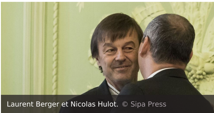
Laurent Berger et Nicolas Hulot.

En présentant en mars dernier un pacte de 66 propositions avec Nicolas Hulot et un collectif d'associations, Laurent Berger a retrouvé de l'influence