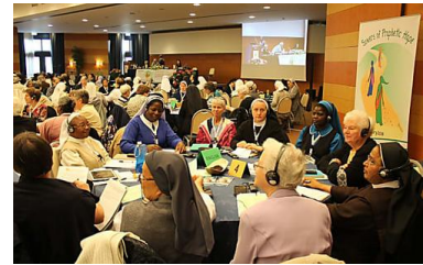
UISG, XXIe Assemblée générale...