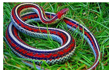
The Deadliest Snakes Ever Found On... STANDARD NEWS