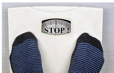
Mincir du ventre : Un truc simple à... SCIENCE ET BIEN-ÊTRE