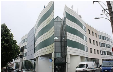
Des étudiants catholiques impliqués...