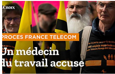
VIDEO - Au procès France Télécom, un...