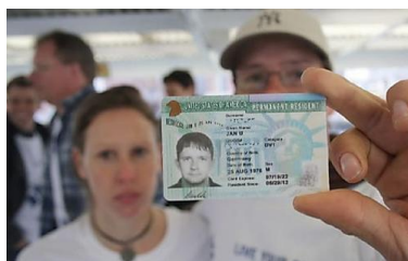
Carte verte des États-Unis. L'inscription... U.S. GREEN CARD - FREE CHECK