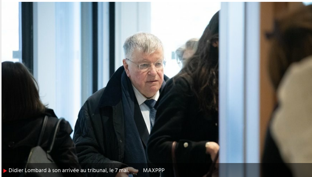
▶ Didier Lombard à son arrivée au tribunal, le 7 mai.

Publié le 19/05/2019 à 13:14 / Modifié le 19/05/2019 à 02:06