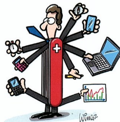
Le manager Idéal

Question : Certains vendeurs labellisés pro n'ont jamais reçu de client pro avant leur labellisation et se retrouvent parfois seuls à l'accueil des pros. Comment ces situations ont-elles pu se produire ? Comment éviter qu'elles ne se reproduisent ?