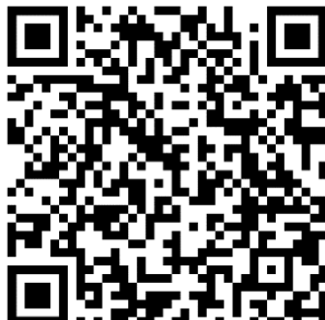
RSE & Environnement